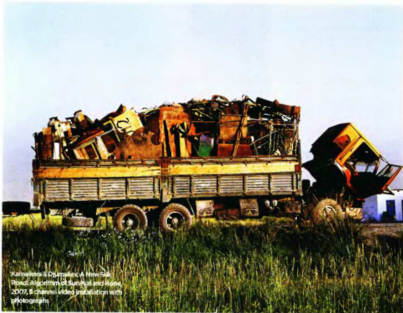
Kahmalieva & Djumaliev, A New Silk Road, Algorithm of Survival and Hope, 2007, 8 channel video installation with photographs