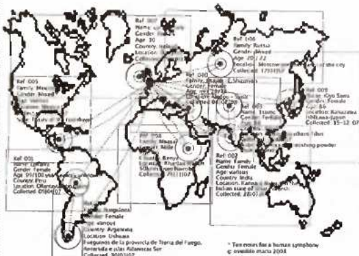
Κάρτες από τα μέρη από τα οποία συλλέχθηκε το πρωταρχικό υλικό.