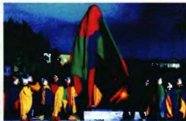
Αριστερά, φωτογραφία του Σ. Καλαφάτη από την έκθεση «10 Όψεις της ελληνικής φωτογραφίας», στο Μουσείο Φωτογραφίας Θεσσαλονίκης. Δεξιά, επάνω έργο του Ν. Κουλιάρη από την έκθεση «Στη Δυναμική της Εικόνας» στο Ίδρυμα Εικαστικών Τεχνών Θεοχαράκη και κάτω «After electricity» του Γ. Σαπουντζή, από την παρουσίαση των υποψηφιοτήτων για το βραβείο ΔΕΣΤΕ, Μουσείο Κυκλαδικής Τέχνης.