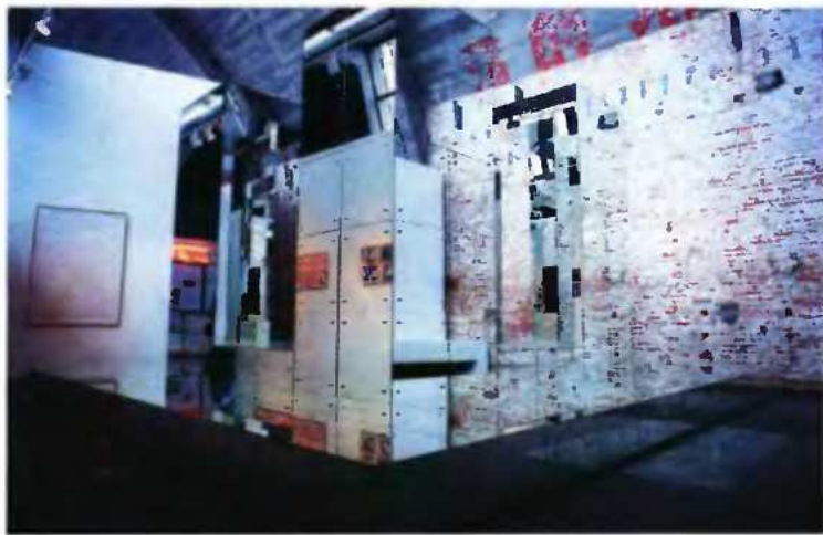
Έργο του Λουκά Σαμαρά από την έκθεση «Heart in Heart» στο Εθνικό Μουσείο Σύγχρονης Τέχνης.