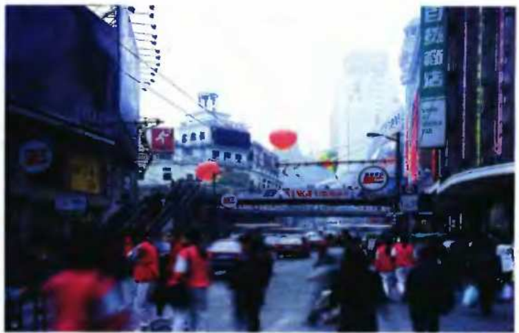
Φωτογραφία του Thomas Struth από την έκθεσή του στο Μουσείο Κυκλαδικής Τέχνης.