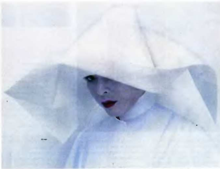
Kimiko Yoshida: «Face to Faces», στο παράλληλο πρόγραμμα της Μπιενάλε Θεσσαλονίκης.

Η «Paint-ID» αποτελεί μια αποτίμηση του ρόλου που διαδραματίζει η ζωγραφική στη σύγχρονη τέχνη. Η έκθεση έχει δύο παραμέτρους: αποτελεί ένα ορόλοιο περί της ιστορικά προσδιορισμένης σχέσης της ζωγραφικής εικόνας με την κοινωνία που την παράγει, αλλά ταυτόχρονα αποτελεί και μια δια-ιστορική αναφορά στις οντολογικές εκείνες συνθήκες της ανθρώπινης κατάστασης, έτσι όπως αυτές, γίνονται σημείο κριτικής δια-