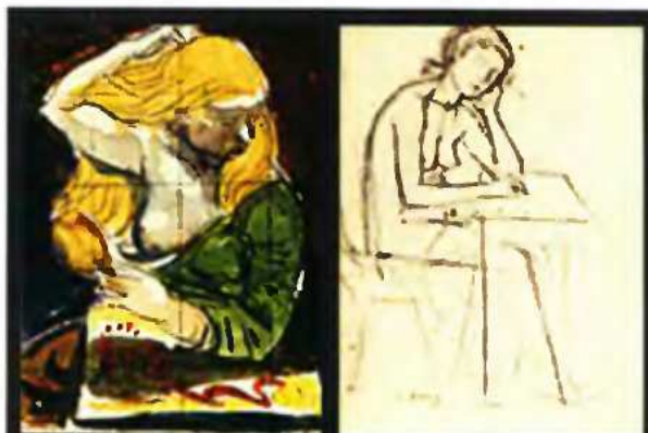
ΕΚΘΕΣΗ με τίτλο «Γλυπτική Μόρφωση, σκίτσα 1934-1994», 9 Απριλίου - 29 Ιουλίου 2009, Μορφωτικό Ίδρυμα Εθνικής Τραπέζης, με τη συνεργασία της γκαλερί Ζουμπουλάκη, Πολιτιστικό Κέντρο ΜΙΕΤ (Βασ. Όλγας 108), Θεσσαλονίκη.