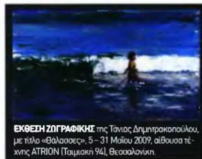
ΕΚΘΕΣΗ ΖΩΓΡΑΦΙΚΗΣ της Τάνιας Δημητρακοπούλου, με τίτλο «Θαλάσσης», 5 - 31 Μαΐου 2009, αίθουσα τέχνης ΑΤΡΙΟΝ (Τσιμακιά 94), Θεσσαλονίκη.