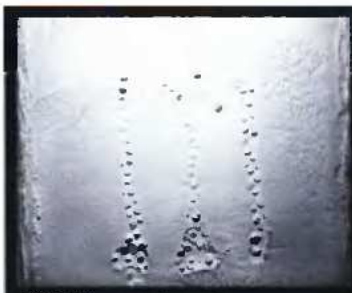
ΕΚΘΕΣΗ (κατασκευή, εγκατάσταση, φωτογραφία και βίντεο) της Αλεξάνδρας Χαριτίδου, με τίτλο «Αποσπύματα», 2 Απριλίου - 15 Μαΐου 2009, γκαλερί ΖΗΤΑ-ΜΙ (Πρ. Κορομηλά 1), Θεσσαλονίκη.