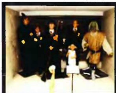
ΕΚΘΕΣΗ κερνίκων ομοιωμάτων από το Μουσείο της Αγίας Πετρούπολης, 18 Μαρτίου - 16 Ιουλίου 2009, Δήμος Θεσσαλονίκης, περιπύλο κινηματοθέατρου «Αριστοτέλειον» (Εθν. Αμύνης 2), Θεσσαλονίκη.