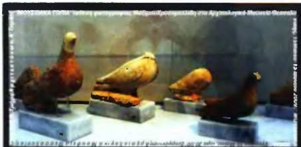
ΕΚΘΕΣΗ ΦΩΤΟΓΡΑΦΙΑΣ του Μάξιμου Χρυσομαλλίδη, με τίτλο «Μουσειακά τοπία», 15 Μαΐου - 15 Ιουλίου 2009, Αρχαιολογικό Μουσείο Θεσσαλονίκης και Α' Τομέας Αρχιτεκτονικού Σχεδιασμού και Εικαστικών Τεχνών του Τμήματος Αρχιτεκτονών του ΑΠΘ, Αρχαιολογικό Μουσείο, Θεσσαλονίκη.