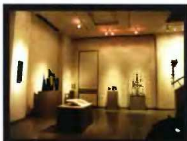
ΕΚΘΕΣΗ ΓΛΥΠΤΙΚΗΣ της Αλεξ Μυλωνά, με τίτλο «Τέχνη και Ζωή», 8 Μαΐου - 30 Ιουλίου 2009, Μακεδονικό Μουσείο Σύγχρονης Τέχνης - Υπουργείο Μακεδονίας Θράκης σε συνεργασία με το Μουσείο Σύγχρονης Τέχνης Φλώρινας, Μουσείο Σύγχρονης Τέχνης Φλώρινας, (κτίριο Εξάρκου, Ταγματάρχου Φουλεδάκη 8), Φλώρινα.