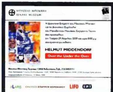
ΕΚΘΕΣΗ του Helmut Middendorf, με τίτλο «Over the Under the Over», 29 Απριλίου - 31 Μαΐου 2009, Μουσείο Μπενάκη και Μακεδονικό Μουσείο Σύγχρονης Τέχνης, Μουσείο Μπενάκη (Πειραιώς 138 & Ανδρονίκου), Αθήνα.