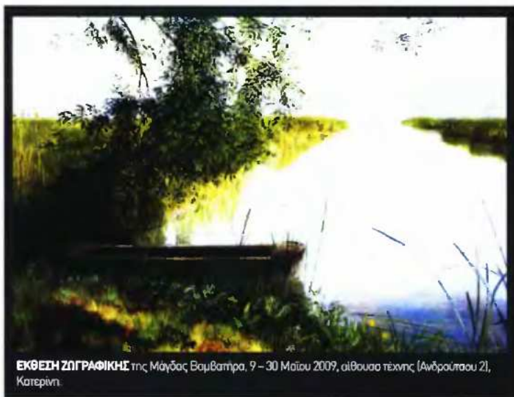
ΕΚΘΕΣΗ ΖΩΓΡΑΦΙΚΗΣ της Μάγδας Βομβάτσα, 9 - 30 Μαΐου 2009, αίθουσα τέχνης (Ανδρούτσου 2), Κατερίνη.