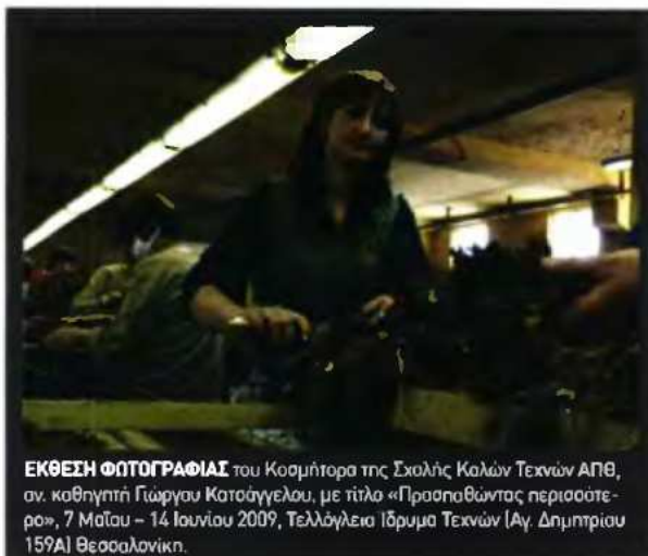
ΕΚΘΕΣΗ ΦΩΤΟΓΡΑΦΙΑΣ του Κοσμήτορα της Σχολής Καλών Τεχνών ΑΠΘ, αν. καθηγητή Γιώργου Κατούγγελα, με τίτλο «Πρασπαθώντας περισσότερο», 7 Μαΐου - 14 Ιουλίου 2009, Τελλόγλεια Ίδρυμα Τεχνών (Αγ. Δημητρίου 159Α) Θεσσαλονίκη.