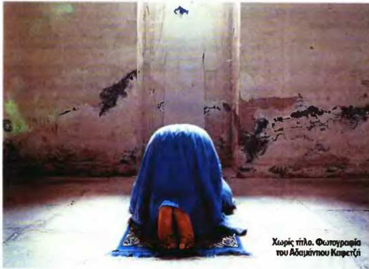
Χωρίς τίτλο. Φωτογραφία του Αδαμάντιου Καφετζή

Η προσωπική καθημερινότητα, ως σφοδρή για κάθε είδους καλλιτεχνική δημιουργία στην τέχνη, τα επιμέρους στοιχεία της ζωής των ανθρώπων σε κάθε έκφασή τους, αποτελούν όχι μόνο θεματική αφορμή καλλιτεχνικής δημιουργίας, αλλά και ιδεολογική επιλογή. Η έκθεση επιχειρεί να διερευνήσει τους διαφορετικούς τύπους προσωπικών επιλογών και πράξεων. «Η πρόθεση της έκθεσης αυτής είναι να ανακαλύψουμε πού συναντιούνται το προσωπικό με το πολιτικό στοιχείο κάθε πράξης (που στην πραγματικότητα είναι δύο πλευρές του ίδιου νομίσματος). Και η ζώνη ανάμεσα στο προσωπικό και το πολιτικό, το ιδιωτικό και το δημόσιο, είναι ακριβώς το σημείο όπου δημιουργείται η τέχνη», σημειώνουν χαρακτηριστικά οι επιμελητές της έκθεσης, ιστορικοί της τέχνης Αρετή Λεοπούλου και Θεόδωρος Μάρκογλου και συνεχίζουν: «Η έκθεση προσκαλεί τον επισκέπτη να πάρει πρωτοβουλίες, να ανακαλύψει και να συγκρίνει έργα, να ανοί-