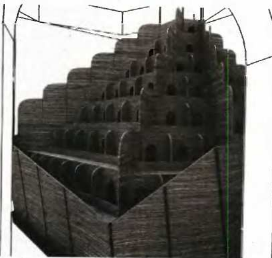
Στα λουτρά Παράδεισος εκτίθεται το έργο της Μαίρης Ζυγούρη «κελιά πάχυνσης πουλερικών».

λη, σε μπαρ και εστιατόρια. Όλες οι εκθέσεις θα διαρκέσουν μέχρι τις 27 Σεπτεμβρίου.